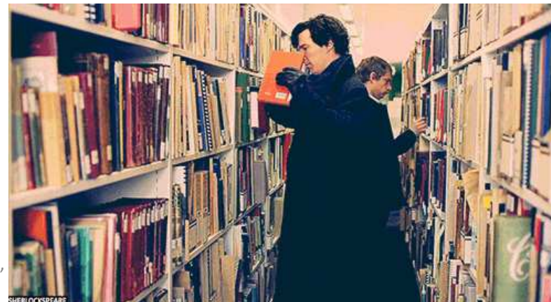
ŽSV knjižničara Istarske županije, Umag,