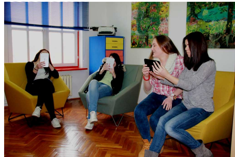
ŽSV knjižničara Istarske županije, Umag, 02.11.2015.