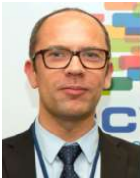
Koen Bois d'Enghien, dužnosnik EQAVET-a, Europska komisija, Glavna uprava za obrazovanje i kulturu

Nakon izbora za Europski parlament u svibnju 2014. godine imenovana je nova Europska komisija na čelu sa Jean-Claudeom Junckerom. Nova Komisija ima ambiciozan plan rasta i donijet će bitne promjene u vezi s upravljanjem strukovnim obrazovanjem i osposobljavanjem unutar Komisije. Odgovornost za strukovno obrazovanje (uključujući Europski referentni okvir za osiguravanje kvalitete u strukovnom obrazovanju i osposobljavanju - EQAVET) i obrazovanje odraslih, kao i strategije vještina i kvalifikacija (uključujući i Europski kvalifikacijski okvir - EQF) bit će prenesena s povjerenika zadužena za obrazovanje, kulturu, mlade i građanstvo na povjerenika za zapošljavanje, socijalna pitanja, vještine i radnu mobilnosti.