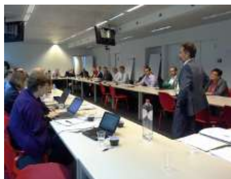
Predstavnici nacionalnih referentnih točaka na sastanku